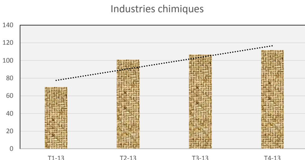
Graphique n°2 : IHPI de la sous-branche Bois et meubles, Base 2012=100

Pour l'ensemble de l'année 2013, la production dans le sous-branche « Bois et vannerie » a observé une tendance haussière.